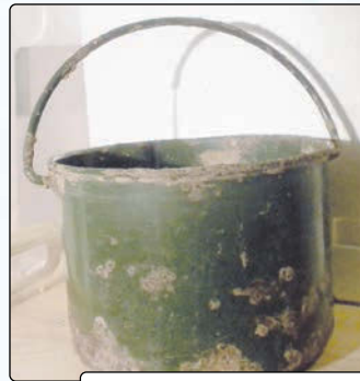
Солдатский котелок — экспонат музея школы № 2 г. Лысьвы